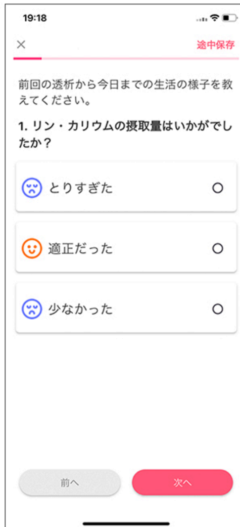
選択形式の質問への 回答画面