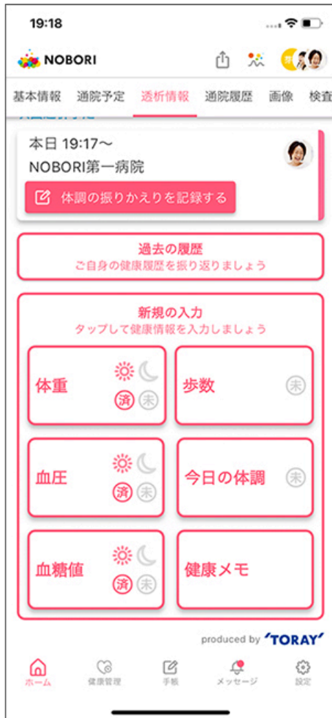
透析患者向け機能の トップ画面