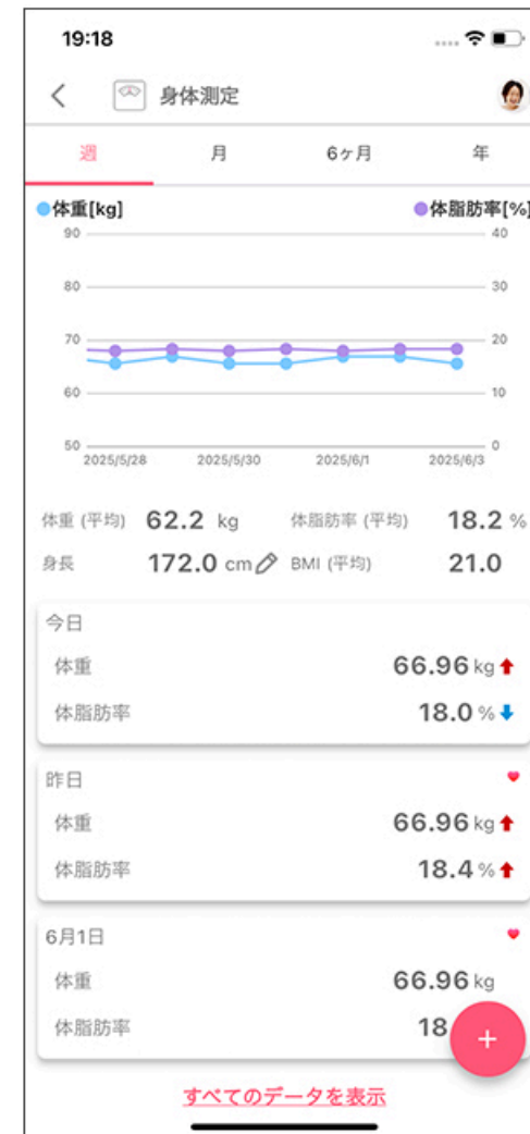
記録した情報のグラフ化

本開発において、東レは、透析患者向けPHRの構想・立案、開発の調整ならびに実証的利用の推進を行っています。東レ・メディカルはMiracle DIMCSへのPHR連携機能の開発を行っており、またPSPはNOBORIアプリ内の追加機能として透析患者向け機能の開発を行っています。なお、NOBORIアプリはPSPが運営しています。