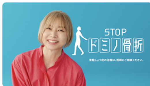
院内ポスター(左)、テレビコマーシャル(右)