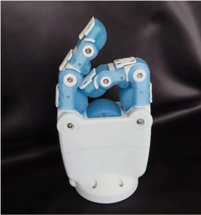
ロボットハンドの指部分（青の部分）

住友ゴム工業(株)は、3Dプリンター※ 1 で加工できる今までにないゴム材料※ 2 を開発しました。これまでは3Dプリンターでゴム製品をつくる事はできませんでした。しかし、今回、高い復元性と繰り返しの圧縮にも強いゴム材料を当社独自の技術で開発し、3Dプリンターで加工できるようにしました。3Dプリンターで主に使われる樹脂（プラスチック）ではできなかった弾力性、耐衝撃性、柔軟ですべりにくいなどのゴムの特性を活かした製品をつくれるようになります。これにより、3Dプリンターの使用用途が大きく広がります。 今後、ロボット、医療、自動車、スポーツなど様々な分野での活用が期待できます。当社では3Dプリンター造形用ゴム材料事業の2026年中の実用化を目指してさらに開発を進めています。これからもお客様により高性能、高品質な製品を提供するとともに安全で健康な暮らしに貢献してまいります。