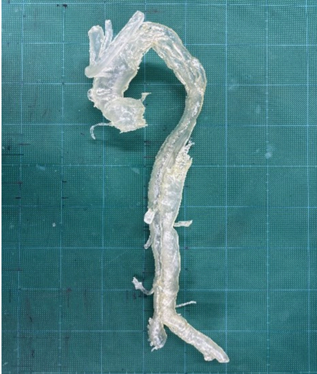
大動脈血管モデルの3D造形