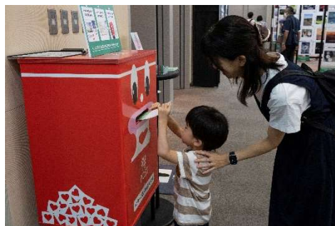
東京・福岡・大阪の会場とオンライン展示サイトからメッセージを投函いただけます。

当社は写真を「撮る」「プリントする」「飾る」「贈る」などひとつ手間をかけることで写真が人を幸せにすることを共有し、写真による幸せを増幅・伝播させていくことを目指す「写真幸福論」プロジェクトを推進しています。今後もお客様のニーズに応えながら、写真をプリントして手に取る喜びや、大切な人との思い出を共有する温かさなど、写真がもたらす幸せを生み出し続けていきます。