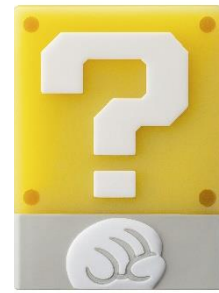
シリコンケース (裏面)