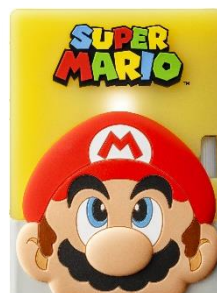
シリコンケース (正面)