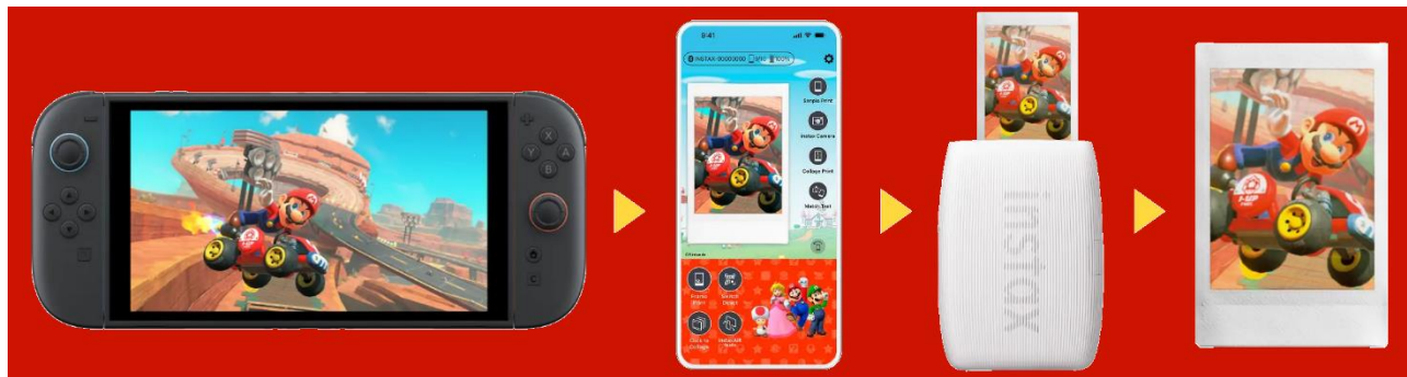
ゲーム画面をチェキプリント™にする手順

当社は、2021 年 4 月に「instax mini Link™ for Nintendo Switch」をリリースして以降、2025 年 6 月には「Nintendo Switch 2」に対応したアップデート版を提供開始。グローバルで幅広いユーザーにご利用いただいています。今回、さらに魅力的な撮影・プリント体験を提供する新機能を搭載したバージョンアップ版をリリースします。