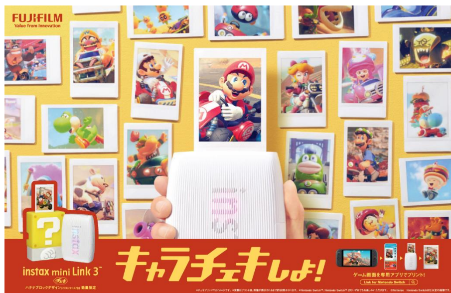
「instax mini Link™ for Nintendo Switch」のキービジュアル

当社は、スマホプリンター「instax mini Link 3™」（以下、「Link 3」）と「スーパーマリオ」のハテナブロックをデザインしたシリコンケースとのセット品を数量限定で 2025 年 11 月 7 日より発売します。ハテナブロックからプリントが出てくるような体験をお楽しみいただけます。