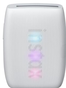
instax mini Link 3™ (CLAY WHITE)