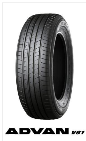
※画像は新型「RAV4」の装着サイズとは異なります。

横浜ゴムは2024年度から2026年度までの中期経営計画「Yokohama Transformation 2026（YX2026）」（ヨコハマ・トランスフォーメーション・ニーゼロニーロク）のタイヤ消費財戦略において高付加価値品比率の最大化を掲げています。その一環として、グローバルフラッグシップタイヤブランド「ADVAN」、SUV・ピックアップトラック用タイヤブランド「GEOLANDAR（ジオランダー）」の新車装着を推進しています。