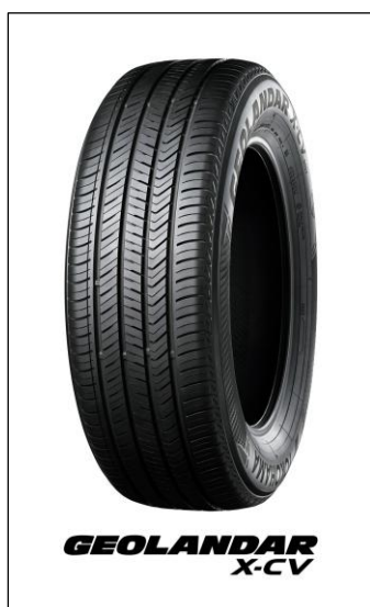
※画像は新型「ソルテラ」の装着サイズとは異なります。

横浜ゴムは 2024 年度から 2026 年度までの中期経営計画「Yokohama Transformation 2026（YX2026）」（ヨコハマ・トランスフォーメーション・ニーゼロニーロク）のタイヤ消費財戦略において高付加価値品比率の最大化を掲げています。その一環として、グローバルフラッグシップタイヤブランド「ADVAN（アドバン）」、SUV・ピックアップトラック用タイヤブランド「GEOLANDAR」の新車装着を推進しています。