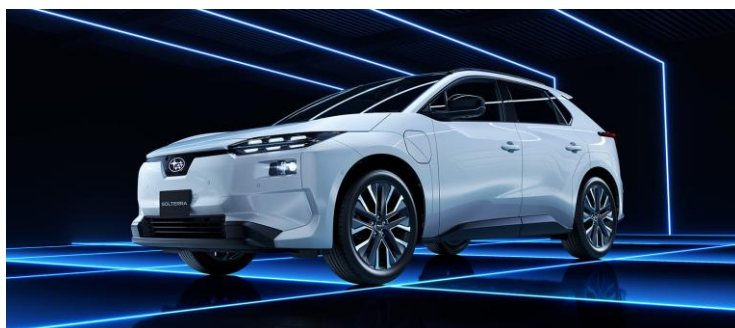
新型「ソルテラ」（画像は日本仕様車）

※本画像は（株）SUBARU の許諾を受け掲載しております。 本画像の他への転載、転用を一切禁止致します