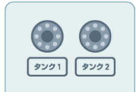
受入口と受入タンクへの品名表示