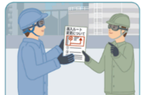
手順や進入ルート変更時の情報共有