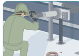
適切な設備の安全管理