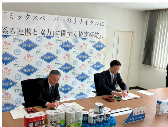
「ミックスペーパーのリサイクルに係る連携と協力」に関する協定締結式

今回の取り組みでは、対象エリアを熱海市全域に拡大し、回収されたミックスペーパーを原料としてコアレックス信栄がトイレ用ペーパーを製造します。製造された製品は、再び熱海市内で活用され、地域内での資源循環を実現します。