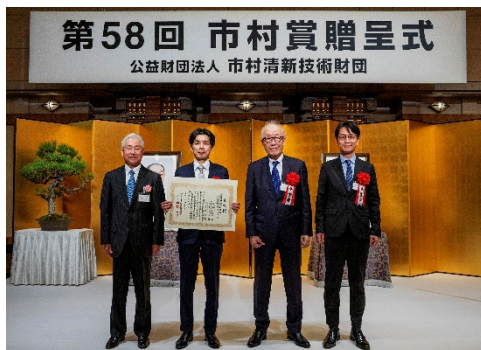
2026年4月17日に開催された贈呈式の様子

今回の受賞テーマは「小児心臓手術における再手術のリスクを減らす心・血管修復パッチ」であり、心・血管修復パッチ「シンフォリウム」の開発に携わった帝人株式会社、福井経編興業株式会社、大阪医科薬科大学の3機関が受賞しました。3機関は、先天性心疾患患者における再手術のリスクを低減し、患者および家族の心的負担の軽減やQOL向上に貢献する心・血管修復パッチ「シンフォリウム」を産学官連携により開発したことが評価されました。また、社会的な必要性が高い一方で患者数が少なくかつ高度な設計技術が求められるために開発への参入が限られている小児用医療機器分野において、今回の3機関の取り組みが子供を救う治療技術革新の先導的な事業化モデルとなる点も評価されました。