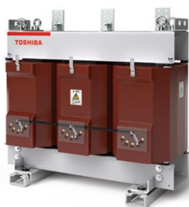
2026 トップランナーモールド変圧器の各種プラスチック部品に バイオマスポリカーボネート樹脂が採用

*三井化学では、エポキシ樹脂やポリカーボネート樹脂原料のバイオマス化で貢献しています。