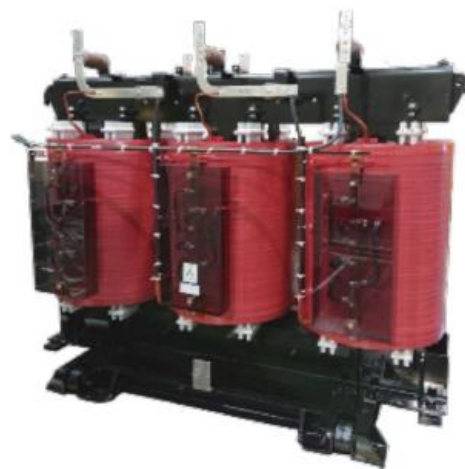
特別高圧モールド変圧器のコイルに バイオマスエポキシ樹脂が採用