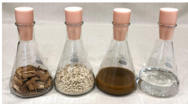
(左から順に) 木材チップ、パルプ、発酵培養液、E2G

航空業界では、脱炭素化に向けた有効な手段の一つとして SAF の社会実装が期待されています。SAF には複数の原料や製造方法があり、現在、世界的には HEFA ※3 技術による SAF 製造が先行しています。しかし、SAF の普及拡大においては原料確保が課題であり、エネルギー安全保障の観点からも原料の多様化が求められています。ATJ は、多様なバイオマスから製造されるアルコールを SAF 原料とすることで、原料の安定調達および多様化に貢献できる技術であり、出光興産はその実証製造に挑戦しています。木質バイオマスに代表される非可食資源由来の国産 E2G を原料とする ATJ-SAF のサプライチェーンが実現すれば、食料との競合を回避しながら、原料生産から製品製造までを国内で完結することが可能です。