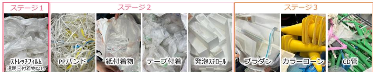
ケミカルリサイクルの対象となる建設系廃プラの区分と発生割合

PP:ポリプロピレン、PE:ポリエチレン、PS:ポリスチレン、PUR:ポリウレタン、PVC:ポリ塩化ビニル