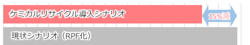
LCAによるCO 2 排出量の算出結果の比較

建設系廃プラへのケミカルリサイクル導入による環境性評価として、LCA(ライフサイクルアセスメント) ※1 による分析を実施しました。建設系廃プラのうち、ステージ1・2に区分されるものが再生油へと再資源化される「ケミカルリサイクル導入シナリオ」と、固形燃料(RPF)化による熱回収(サーマルリカバリー)が実施される「現状シナリオ」の2つのシナリオを対象に、実証事業で得られた実データに基づいてCO 2 排出量を算定しました。その結果、建設系廃プラの35%をケミカルリサイクルすることにより、現状シナリオと比較してシナリオ全体でCO 2 排出量の総量を15%削減でき、建設系廃プラの再資源化率向上とCO 2 排出量削減を同時に達成したことを確認しました。