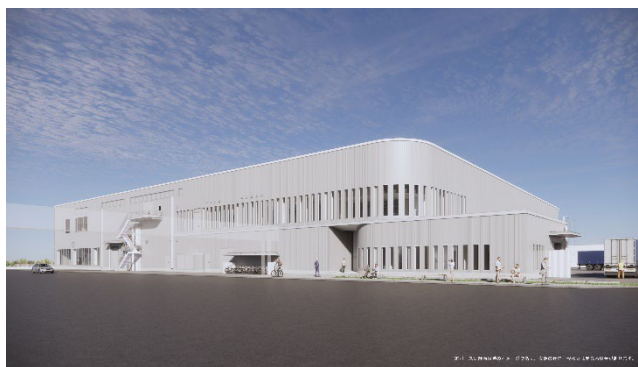
新設設備の完成予想図

今回の新規設備建設計画は、2026年秋完工予定の堺事業所におけるセパレータ原膜製造設備に続くもので、2026年度中の第1期着工を決定し、さらに2029年度には第2期着工を予定しております。これらにより宇部マクセルのセパレータ原膜製造能力は、現行比で約50%増となります。