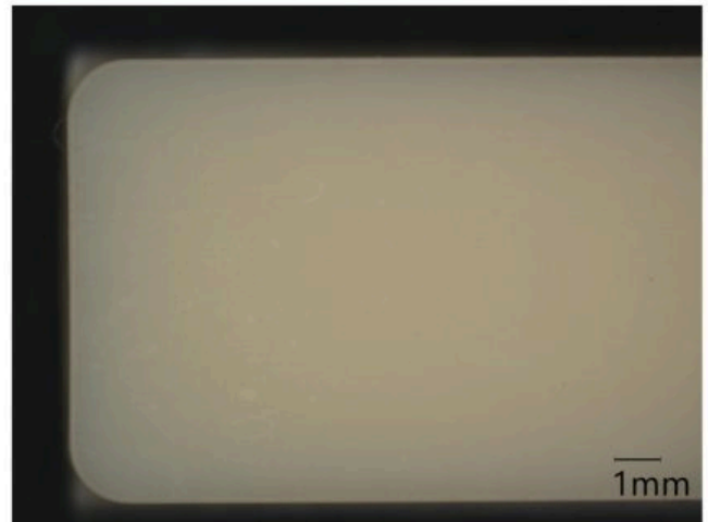
PHB樹脂：PO-3S添加/ヒケなし