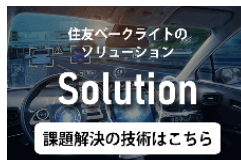
住友ベークライトの SOLUTION

PDF 蘇州住友電木有限公司における半導体封止材の生産能力増強について (PDF 597KB)