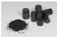
半導体封止用エポキシ樹脂 成形材料