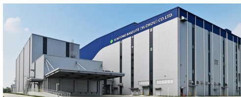
蘇州住友電木有限公司 半導体封止材の新工場 (2024年竣工)

当社グループは、半導体封止材の生産拠点を、日本、中国、シンガポール、台湾、ベルギーに有し、主要市場に対して安定供給を図っています。今回の中国における生産能力増強を通じて、AI関連など次世代半導体分野における高機能・高品質の製品の供給体制を強固にし、半導体封止材のリーディングカンパニーとしてプレゼンスを一層高めてまいります。