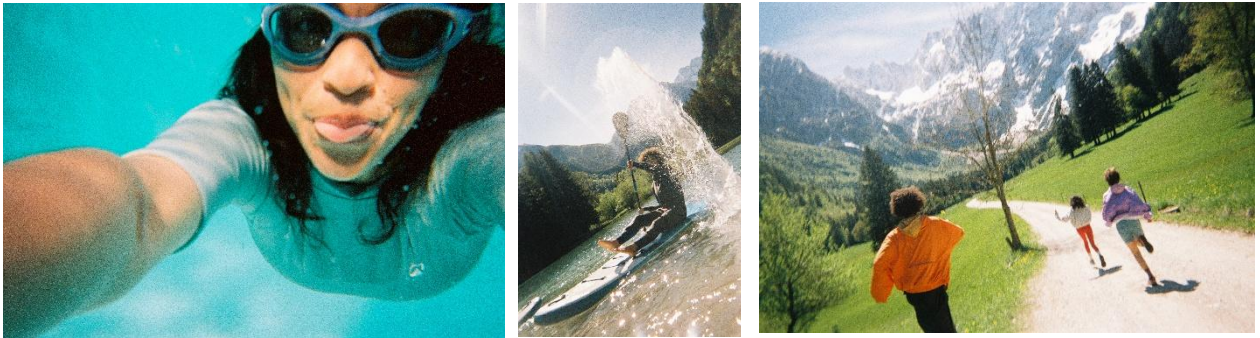
「写ルンです Active™」で撮影した作例

本体をプラスチックで覆うことで、水深 10m までの防水性を実現。海やプールなどの水辺はもちろん、ウィンタースポーツやキャンプなど、アクティブなシーンでの撮影に最適です。通常モデルより大きいフィルム巻き取りノブとレバー型のシャッターボタンを採用し、水中や手袋を付けているシーンでも簡単に操作できます。また、付属の「写ルンです Active™」専用ハンドストラップを取り付けることで、アクティブなシーンでも快適に撮影を楽しめます。