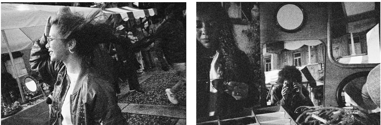
「写ルンです Black and White™」で撮影した作例

シャープで粒状感の滑らかな表現が特長の黒白フィルムを搭載。黒と白の2色で表現することで、特別な設定や技術を必要とせずに、街角のスナップや大切な人と過ごすひとときなど日常のワンシーンを被写体がより際立つ洗練されたアーティスティックな写真に仕上げることができます。