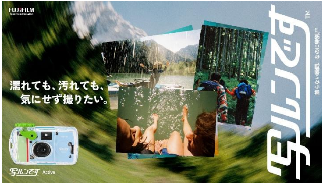
「写ルンです Active™」のキービジュアル

富士フイルム株式会社（本社：東京都港区、代表取締役社長・CEO：後藤 禎一）は、発売 40 周年を迎えたレンズ付フィルム「写ルンです™」シリーズの新商品として、防水モデルの「写ルンです アクティブ Active™」と黒白フィルムモデルの「写ルンです ブラック アンド ホワイト Black and White™」を発売します。「写ルンです Active™」は 2026 年 8 月上旬、「写ルンです Black and White™」は 9 月以降に発売予定です。