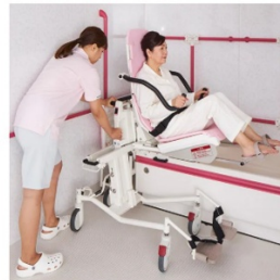
レールでスライド