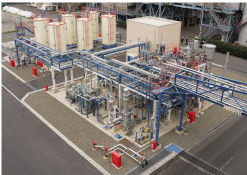
川崎臨海部脱水素プラント

引き続き当社はAHEAD組合員企業である三菱商事株式会社、三井物産株式会社、日本郵船株式会社と連携し、さらに多くの方々からのご協力やご支援をいただきながら、水素サプライチェーンの実証運用を通じ、国際間水素輸送の実効性の確認に取り組んで参ります。今後とも皆様のご支援をいただきたくよろしくお願ひ申し上げます。