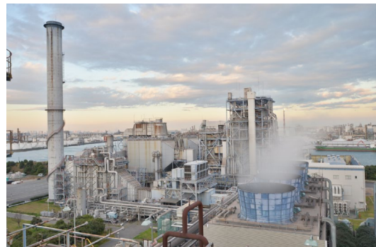
水素供給先ガスタービン