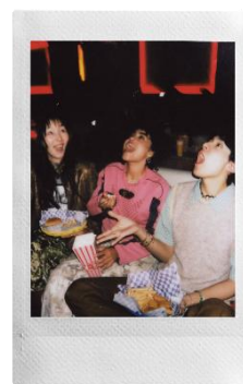
「オート露光機能」で明るい場所でも、光量の少ない場所でも、最適な明るさで撮影可能