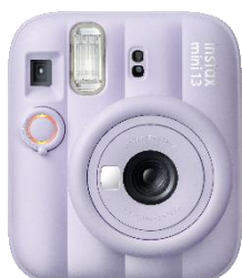
ドリーミーパープル