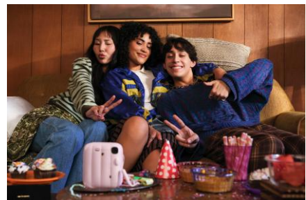
セルフタイマーを使用し自撮りをする様子