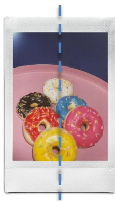
ファインダーから見たイメージ通りに中心をずらさず撮影！