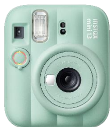
ラグーングリーン