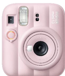
キャンディーピンク