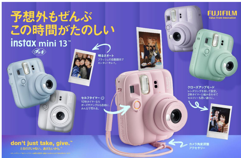
「mini 13」のキービジュアル

「mini 13」は、シンプルな操作で誰でも簡単・きれいに、狙い通りの撮影ができる「instax mini 12™」（以下、「mini 12」）を、デザイン・機能ともに進化させたアナログインスタントカメラです。カメラ本体は、ファッションアイテムとしても持ち歩きたくなるようなぷっくりとした立体感が特長のポップなデザインに仕上げました。