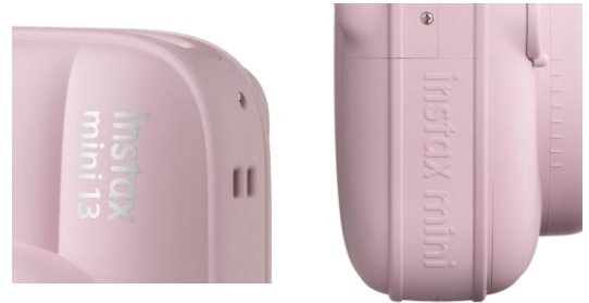
カメラ正面と側面にロゴを配置